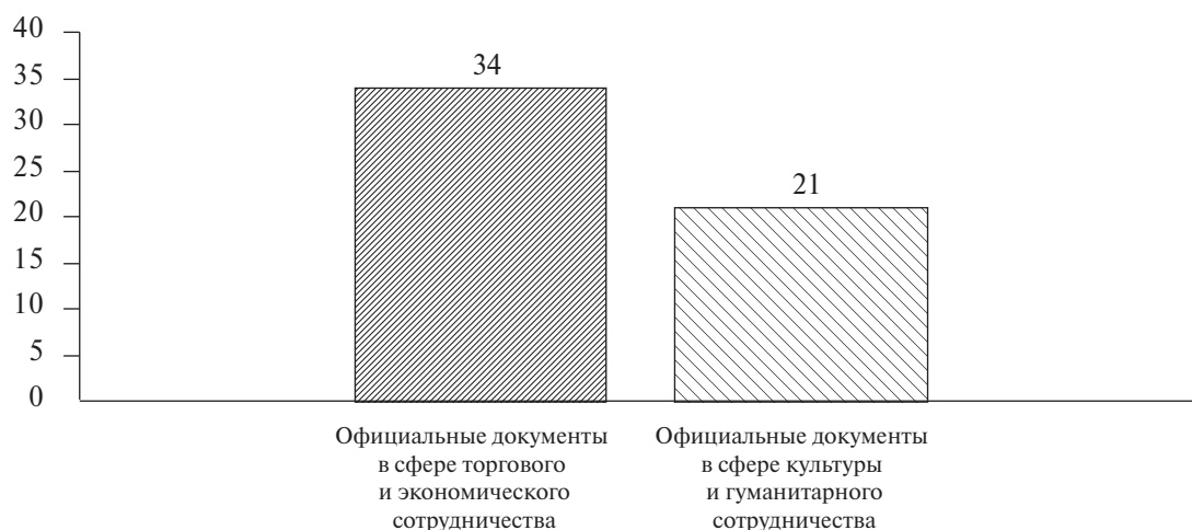
Рис. 1. Заявления, соглашения и другие официальные документы ШОС, 2022 г.

международных организаций [Президент России, 2002]. Согласно «Декларации глав государств – членов Шанхайской организации сотрудничества о построении региона долгосрочного мира и совместного процветания», государства-члены «убеждены, что невозможно обеспечивать собственную безопасность за счет безопасности других» [Посольство КНР в России, 2012]. Бывший генеральный секретарь ШОС Рашид Алимов отмечал, что «шанхайский дух» придает особую привлекательность организации, «этот уникальный принцип по праву считается стержневым в становлении сотрудничества шести государств как новой модели регионального взаимодействия. Являясь основным интегральным понятием и важнейшим принципом деятельности ШОС, “шанхайский дух” обогатил теорию и практику современного международного сотрудничества, претворяя в жизнь всеобщее стремление мирового сообщества к демократизации международных отношений» [ТАСС, 2016].