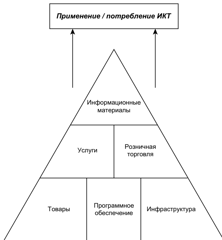
Рис. 2. Типология подсекторов ИКТ