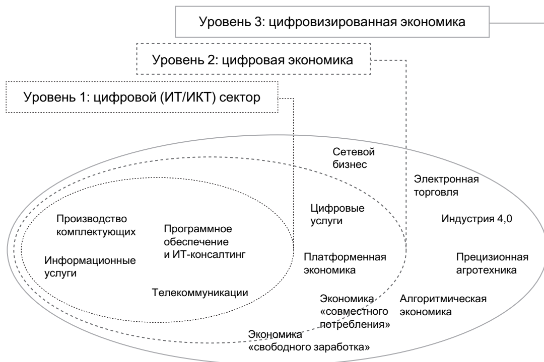
Рис. 3. Три уровня цифровой экономики