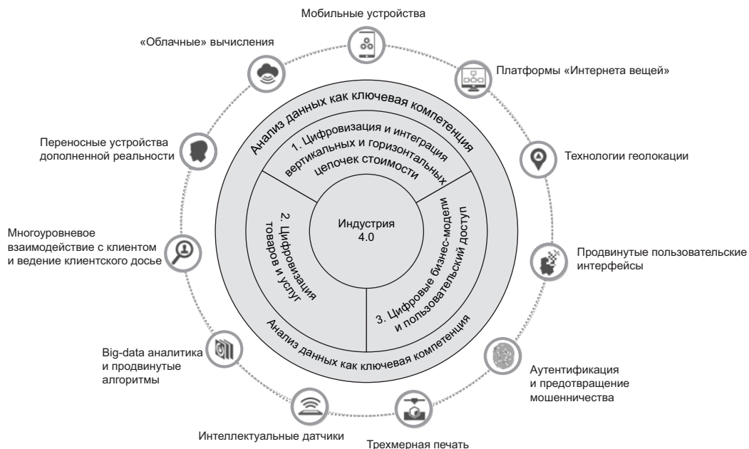
Рис. 1. Индустрия 4.0 и сопутствующие технологии